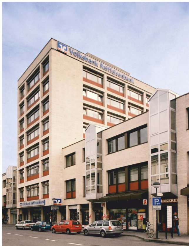
Volks- und Raiffeisenbank Mangfalltal - Rosenheim eG

Nachdem die Bank bereits bei der Inbetriebnahme des ersten VMware ESXi-Systems von der bn-its banking & network it solutions GmbH betreut wurde, war schnell klar, dass auch der Ausbau des Systems zum VMware Cluster in Kombination mit einem komplett redundanten iSCSI Storage mit Unterstützung dieses Partners durchgeführt werden sollte. Die bn-its konfigurierte die Bestandteile des Systems (Switches, zusätzlicher ESXi-Server und Storage), erstellte eine komplette Systemdokumentation und installierte die Lösung vor Ort. Der bestehende ESXi-Server wurde in diesem Zusammenhang nahtlos in den VMware-Cluster integriert. Die bereits existierenden virtuellen Maschinen wurden von den lokalen Festplatten auf den Open-E iSCSI-Cluster verlagert. Die starline Computer GmbH wurde als etablierter Value Added Distributor für die Ausarbeitung eines Konzepts ausgewählt. Eine Lösung, basierend auf NASdeluxe-Systemen mit Open-E DSS V6-Software, erfüllte alle Anforderungen der Volks- und Raiffeisenbank. Als echter Alleskönner stellt das NASdeluxe System den ESXi-Servern blockorientierten Speicher per iSCSI zur Verfügung. Zusätzlich könnte das NASdeluxe den Clients und Servern filebasierten Speicher per NAS (SMB, NFS, etc.) zur Verfügung stellen. Open-E DSS V6 sorgt hier für die einfache Handhabung.